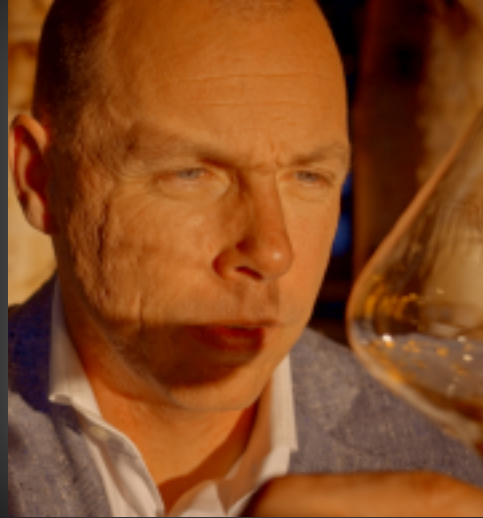
Pasquinel Kolk Restaurant Ciel Bleu**